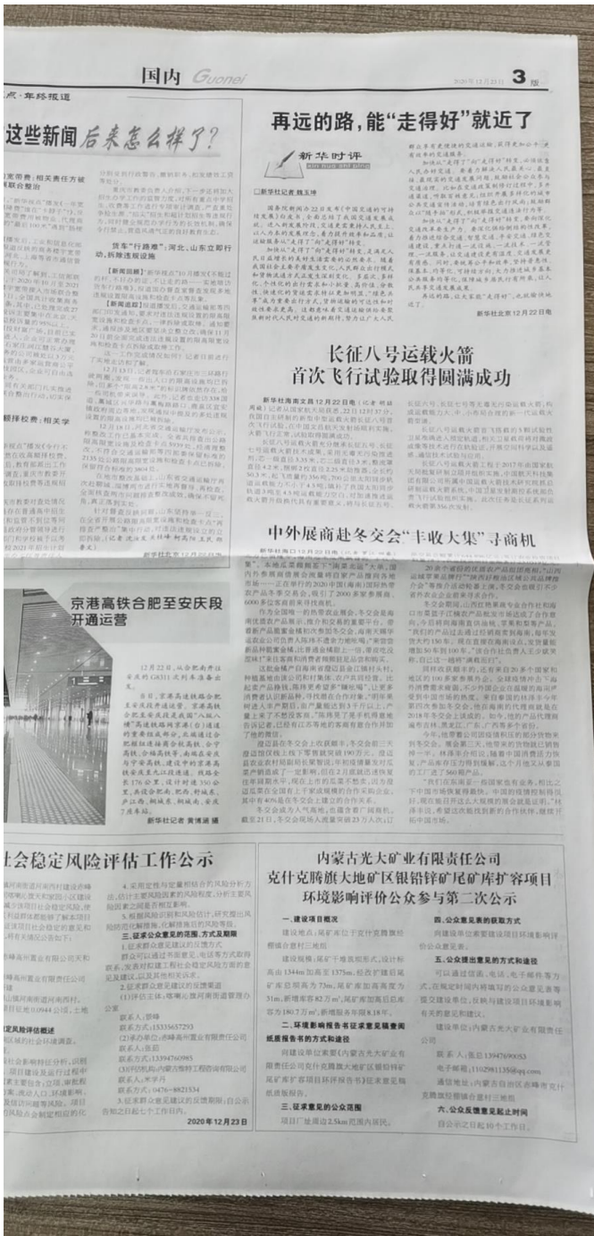
图 3-3 征求意见稿第二次报纸公示