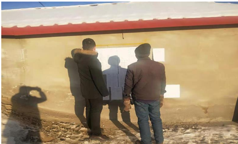
图 3-4 现场公示照片